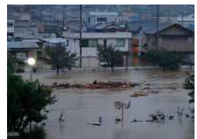
たいすい きいはんとう大水 たいすい がいがい