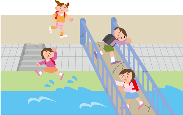
かわ 川や はしの ちかく