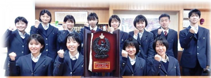
優勝報告をする陸上競技部 長距離ブロックの選手たち