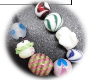
（実習で作成したトンボ玉）

※2020（令和2）年7月頃に正式に発表されます。 詳しくは、三重県教育委員会からの発表をご確認ください。