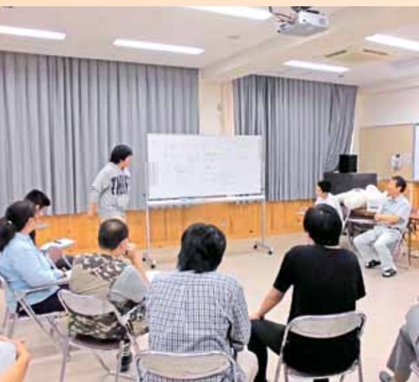
プレゼンテーションの演習

※ 1限～4限の授業を習得したうえ、5～8限の授業を選択し、3年での卒業を目指せます。(選択)