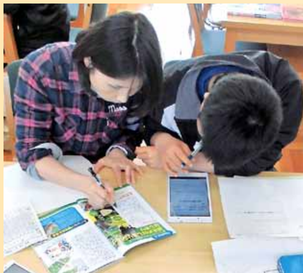
タブレットPCによる調べ学習

大学や短大・専門学校への進学、企業への就職、また各種検定、資格取得など、学習者のニーズに対応した教育を行います。