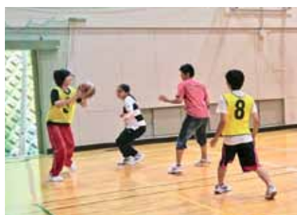
バスケットボール部